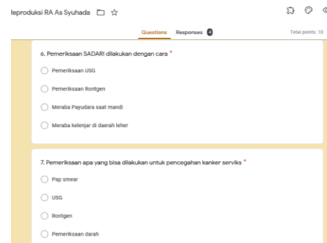
Gambar 3. Google form pre dan post test

Tabel 2. menunjukkan rata-rata tingkat pengetahuan kesehatan reproduksi khususnya terkait pengetahuan metode pemeriksaan IVA, SADARI dan Pap Smear . Hal ini dapat dilihat dari rata-rata hasil pre-test peserta adalah 6,7 dan pada post-test adalah 9. Didapatkan nilai terendah pada pre-test adalah 2 dan pada post-test adalah 8. Nilai tertinggi untuk pre-test dan post-test adalah 10. Terdapat peningkatan pada pengetahuan peserta setelah dilakukan penyuluhan, dapat dilihat dari rata-rata nilai yang didapatkan dari hasil post-test lebih tinggi jika dibandingkan dengan nilai rata-rata pre-test .